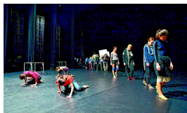
Ponovo ispričana i kazališno strukturirana priča

Igora Moisejeva i 1968. u koreografiji Jurija Grigoroviča, a tek je ova produkcija donijela baletu najveću popularnost.