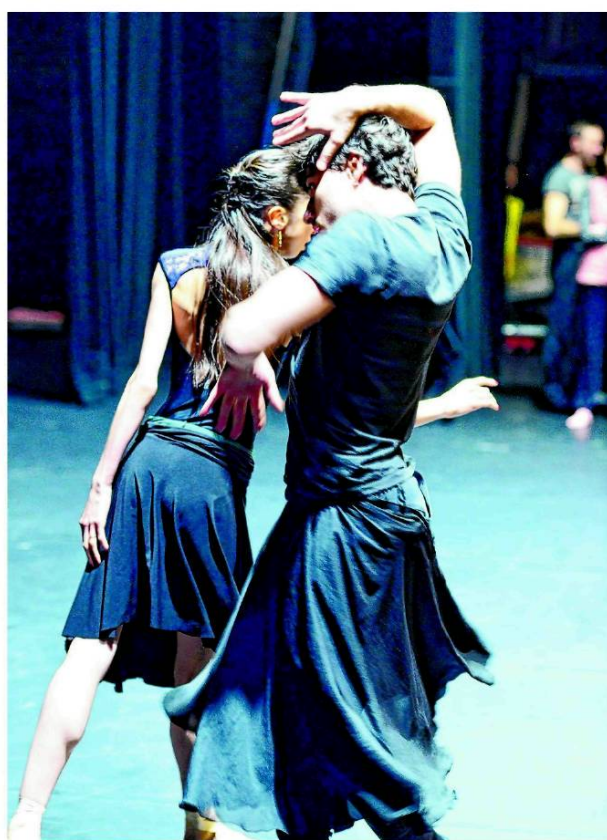
Detalj s probe zagrebačkog Baleta

Aram Hačaturjan (1903. - 1978.) armenski je skladatelj i dirigent. Kako navodi mrežno izdanje Hrvatske enciklopedije, Hačaturjan je izgradio osebujan glazbeni jezik koji se temelji na spoju sastojaka folklorne glazbe Armenije i drugih kavkaskih krajeva sa sastojcima novije zapadnoeuropske skladateljske tehnike. Njegova su djela obilježena širokom pjevnom melodijskom linijom, bogatim ritmičkim pomacima, blještavim orkestralnim koloritom i povremenim smjelijim harmonijskim postupcima.