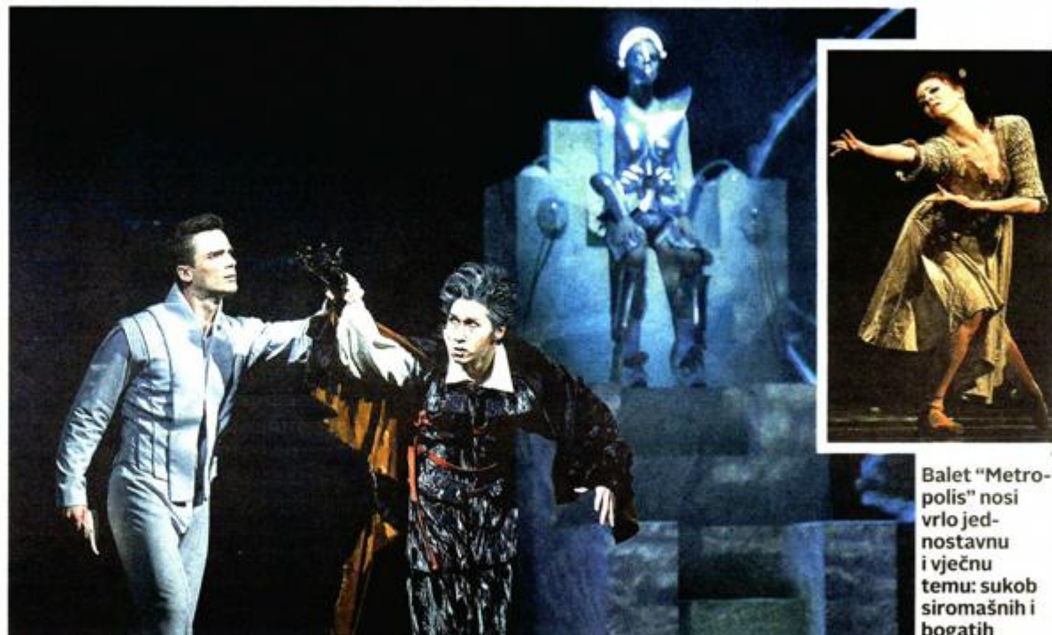
Balet "Metropolis" nosi vrlo jednostavnu i vječnu temu: sukob siromašnih i bogatih

U svom tek naizgled kompliciranom troslojnom odnosu - roman, film, balet - "Metropolis" zapravo nosi vrlo jednostavnu i vječnu temu: sukob siromašnih i bogatih, bujanje kapitalizma na grbači potplaćenih i potlaćenih, pobunu i kaos, i obligatnu, ali ne i tipičnu kazališnu ljubav između pripadnika suprotstavljenih klasa jer ona je svojevrсна biblijska Marija, a on bogatun koji se na kraju pretvara u Posrednika koji će pomiriti nepomirljivo! U svemu tome sudjeluju i robotika u nastajanju i Vječni vrtovi blagostanja u nestajanju, i Sedam smrtnih grijeha kao opomena, i mala djeca radnici koje treba osloboditi... Reklo bi se čitav kompendij civilizacije koji je trebalo prevesti u baletno-plesni medij. Jiri Bubenček učinio je to na narativan način, poput velike slikovnice s puno mimike i gestikulacije, također